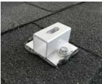
アスファルトシングル