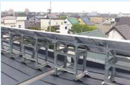
無落雪屋根にも対応可能です。